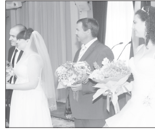
Сколько СВАДЕБ уже сыграли в районе с. 8