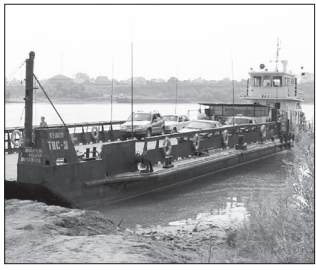
Когда закроют паромную ПЕРЕПРАВУ с. 3