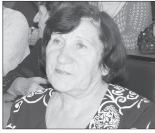
В СЕЛЬХОЗТЕХНИКУМЕ вспомнили его историю с. 5