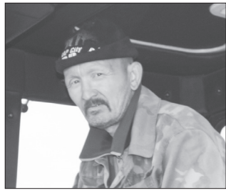
Передовики из УЛЕНКУЛЯ завершают сельхозработы с. 4