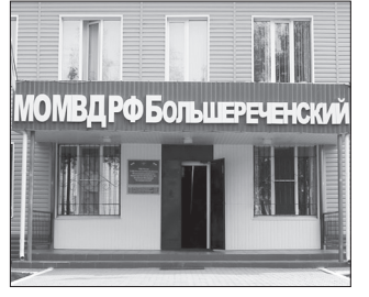
В БОТВИНО украли орудие труда с. 9