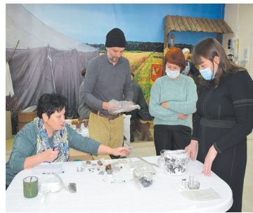
Весть от без вести пропавших - с. 7