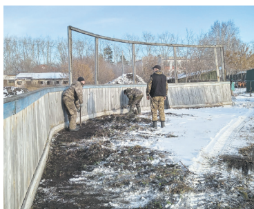
Красноярцы готовятся встать на коньки - с. 3

«ДИАЛОГ С ГЛAVOЙ» В ПОНЕДЕЛЬНИК, 15 НОЯБРЯ, С 15 ДО 16 ЧАСОВ В РЕДАКЦИИ ГАЗЕТЫ! ЗВОНИТЕ ЗАРАНЕЕ ИЛИ В ЭТОТ ДЕНЬ ПО ТЕЛ. 8-913-682-44-50, 8-950-797-50-32