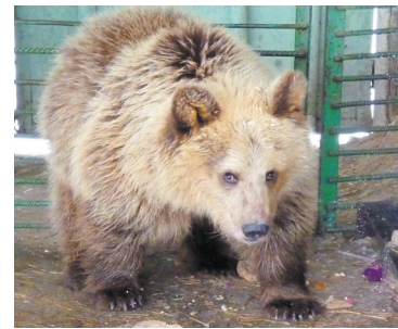
Откуда приехал Макар, новый житель зоопарка - с. 14