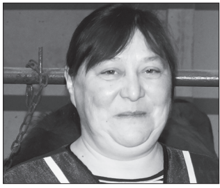
Оператор машинного доения из «Лидера» получит автомобиль с. 3