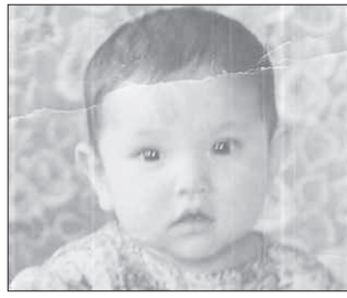
Новая рубрика «Узнай руководителя!» с. 4