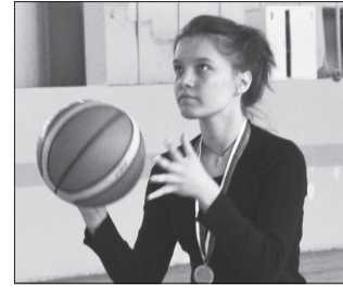
Наши баскетболисты завоевали «золото» с. 8