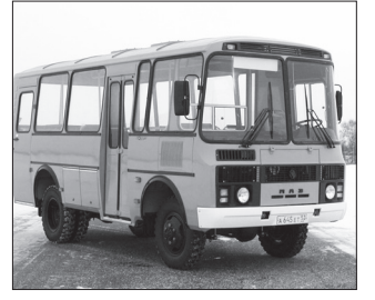
Как изменятся автобусные маршруты? с. 9