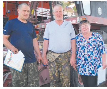
Профсоюз АПК чествует полеводцов района - с. 7