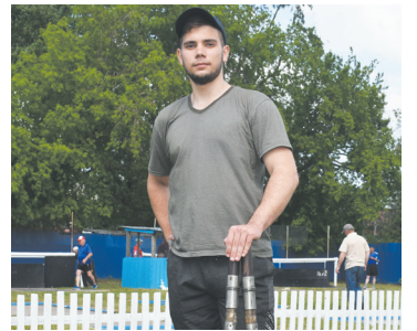
Большереченцы в финале «Королевы спорта»! - с. 8