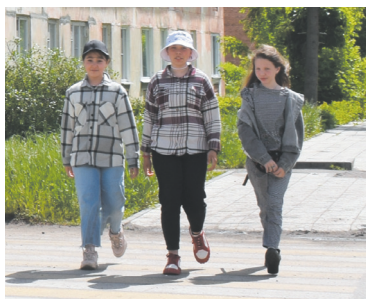
Чтобы лето для детей было безопасным! - с. 3