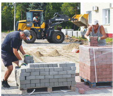
В центре Большеречья построят ещё 2 парковки - с. 4