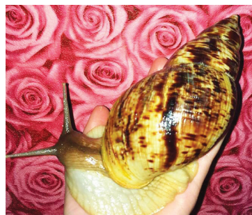
Домашние питомцы открывают секрет вечной молодости - с. 10