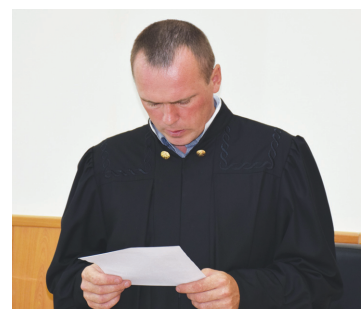
Полная хроника происшествий за неделю - с. 13