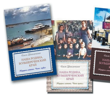
Земляки из разных уголков планеты - в народной летописи - с. 10