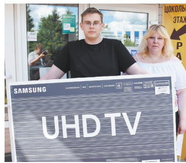
«Мой регион». Кто получил самые крупные подарки в районе - с. 10