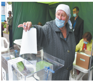
Голосуем всем двором! Как это впервые было в посёлке - с. 4

«ДИАЛОГ С ГЛАВОЙ РАЙОНА» В ПОНЕДЕЛЬНИК, 6 ИЮЛЯ, В РЕДАКЦИИ ГАЗЕТЫ. ЗВОНИТЕ ЗАРАНЕЕ ИЛИ В ЭТОТ ДЕНЬ С 15 ЧАС ДО 16 ЧАС ПО ТЕЛЕФОНАМ 8-913-682-44-50, 8 (381-69) 2-23-40.