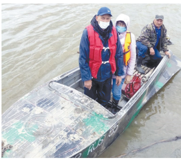
На лодке, мотоблоке и велосипедах - к избирателям! - с. 5