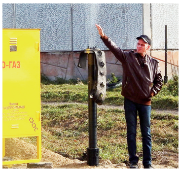
В Ингалах - проверка газопровода - с. 4