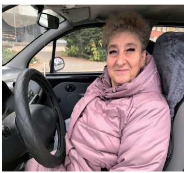
Автомобилисты встречают свой праздник - с. 7, 9