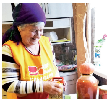
Из тыквы и свёклы. Рецепты хозяюшек - с. 9