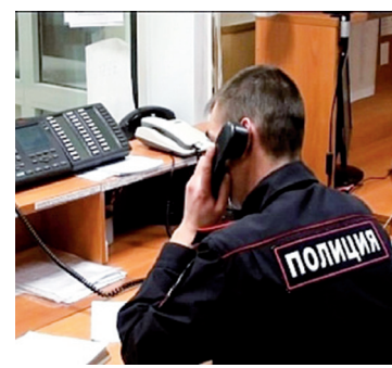
Хроника происшествий и пожаров за неделю - с. 13