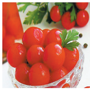
Секреты соленья томатов из Решетниково - с. 10