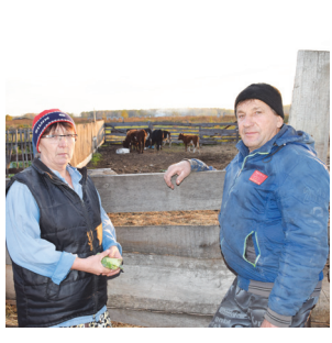
Как жители сёл и деревень зарабатывают на молоке - с.4