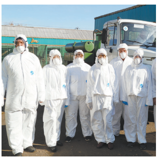
Противоэпизоотическая команда прибыла в зоопарк - с.3