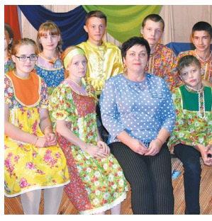
В Курносово детство всех цветов «Радуги» - с. 6