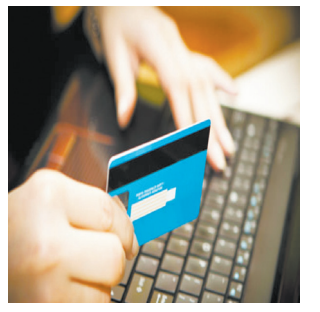
Пенсионеры Большеречья вновь попались на уловки мошенников - с. 13