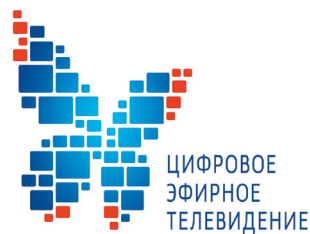
Скоро в районе включат 20 цифровых телеканалов с. 10