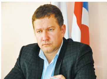
Почему в Большеречье приехал министр Чекусов – с. 3