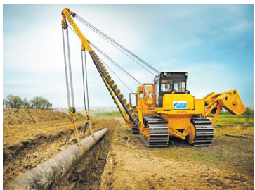
Газификация района. Как сэкономить на проекте – с. 2