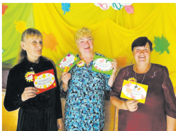
Названы лучшие пожилые рукодельницы – с. 8