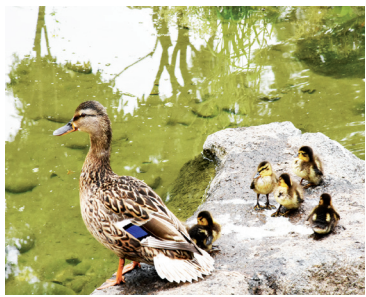
Выявлен очаг заболевания птичьим гриппом в районе - с. 3

«ДИАЛОГ С ГЛАВОЙ РАЙОНА» В ПОНЕДЕЛЬНИК, 24 АВГУСТА, В РЕДАКЦИИ ГАЗЕТЫ. ЗВОНИТЕ ЗАРАНЕЕ ИЛИ В ЭТОТ ДЕНЬ С 15 ЧАС ДО 16 ЧАС ПО ТЕЛЕФОНАМ 8-913-682-44-50, 8 (381-69) 2-23-40.