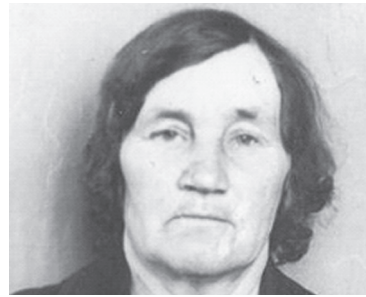
Жительница Колбышево отметила вековой юбилей - с. 8