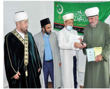
В Большеречье официально открыли мечеть - с. 8