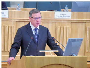
Показательный год. О работе правительства в 2018-м - с. 2-3