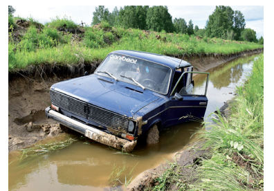
ДТП в Большеречье: повреждены 2 автомобиля - с. 5