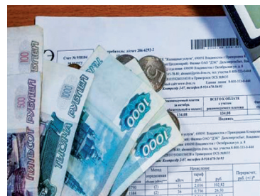
ТКО: спрашивали-отвечаем - с. 5