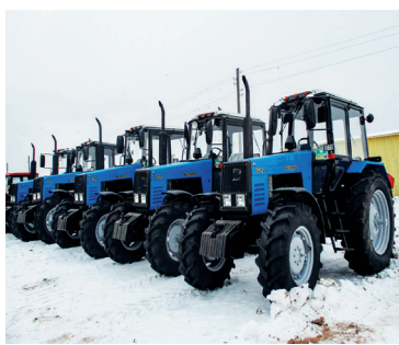
На 160 миллионов рублей обновлено техники в районе - с. 3