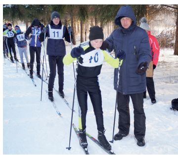
Лыжники района сдали ГТО! - с. 8