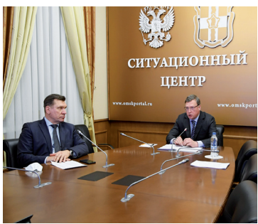
Губернатор назвал сроки газификации Большеречья - с. 2