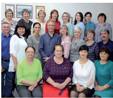
За маткапиталом без заявлений - новости ПФР - с. 6