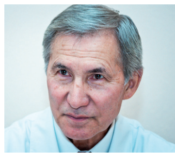
Несущий свет и добро людям - наш депутат! - с. 9