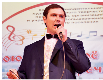
«Пою тебе, моё родное Большеречье» - с. 6