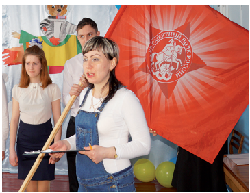
В район доставлено «Знамя Победы» - с. 3