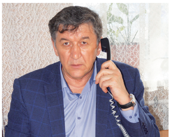
«Диалог с главой района» - с. 4