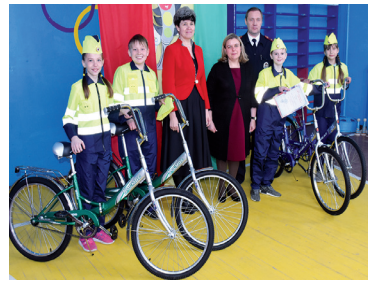
Инспекторы движения выиграли велосипеды - с. 7